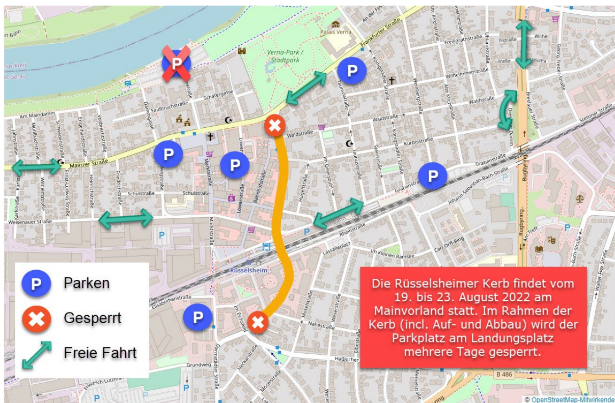
Eine Information des Gewerbeverein Rüsselsheim #GV1888gehtvoran

(23.06.2022) Nach einem Ortstermin des Bauausschusses Anfang Mai hat die Stadt gemeinsam mit dem Bauunternehmen nochmals unterschiedliche Varianten zum weiteren Zeitablauf der Baustelle Stadterführung Friedensstraße geprüft. Im Ergebnis hält die Stadt an der ursprünglichen Planung mit einer Vollsperrung ab dem 24. Juli, mit Beginn der Sommerferien fest. Denn in den Ferien ist das Verkehrsaufkommen in der Regel deutlich niedriger, und in den Sommermonaten ist es auch besser möglich, alternativ auf das Fahrrad umzusteigen oder zu Fuß unterwegs zu sein. Grundsätzlich ist die Vollsperrung unumgänglich, um die Abdichtung der Betonbodenplatte und die Asphaltschichten der Fahrbahn in einem Durchgang herzustellen und die entsprechenden vorbereitenden Instandsetzungsarbeiten fachgerecht ausführen zu können. Die Vollsperrung wird über die Sommerferien hinaus bis voraussichtlich Anfang Oktober notwendig sein.